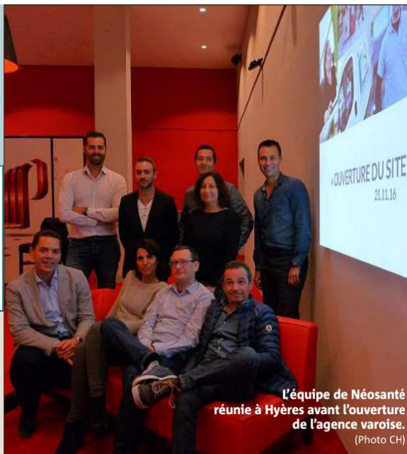
L'équipe de Néosanté réunie à Hyères avant l'ouverture de l'agence varoise.

Néosanté a pris un premier bail d'un an pour des locaux neufs de 100 m 2 à La Moutonne. Si l'activité se développe, la société optera pour des locaux plus grands. Le premier défi consiste à gagner des parts de marché pour agrandir l'espace, stocker plus de matériel, et embaucher.